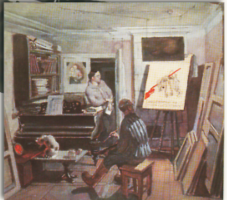
«Автор «Окон РОСТА» на Алтае» Стр. 48