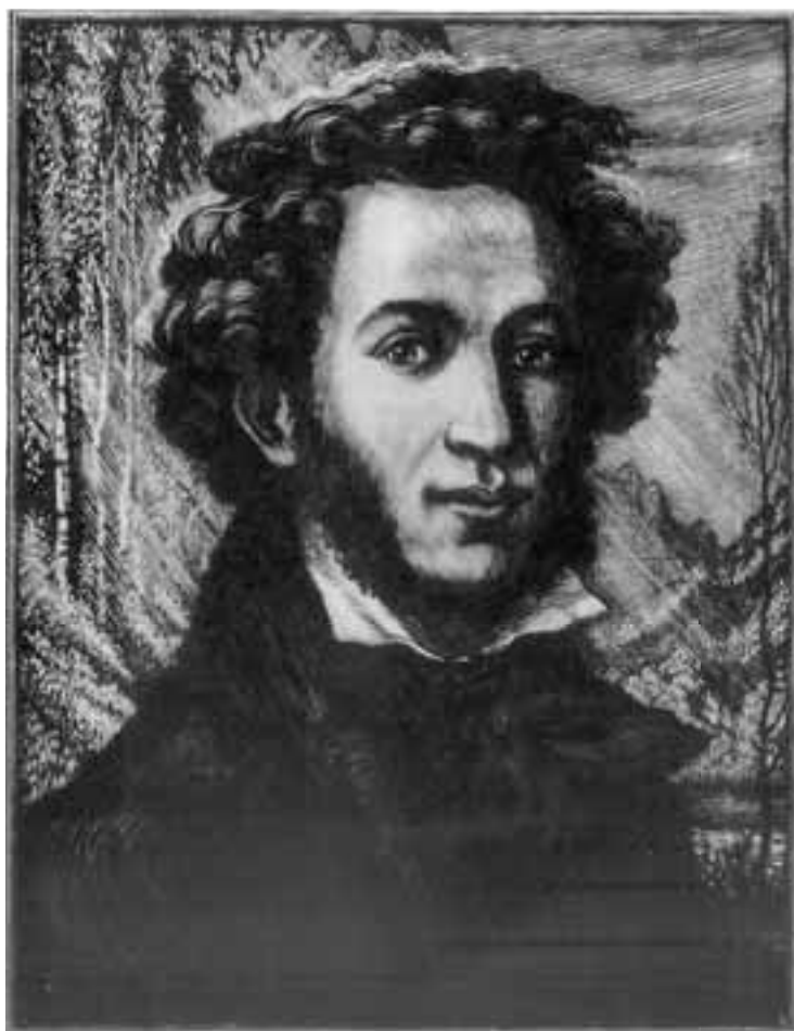
Ф. Константинов. Портрет А.С. Пушкина. Гравюра на дереве. 1948.