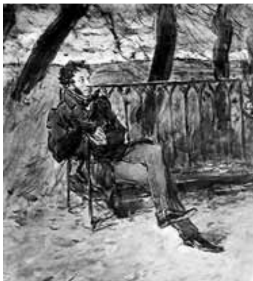
Н. Ге. Пушкин у Пушкина в Михайловском.