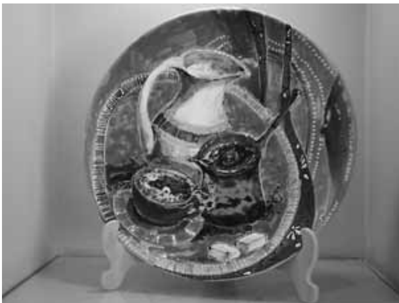
Декоративное блюдо «Кофейное».

Выставка получилась одновременно серьезной и игривой, что приветствуется современной культурой. Лишь одно не учли организаторы: не подумали про интерактивный конкурс, когда каждый посетитель выставки мог бы выбрать понравившегося ему художника, которого следовало бы наградить соответствующим тематике призом. Проект вышел на «отлично». Подобная творческая акция может иметь продолжение в следующем году.