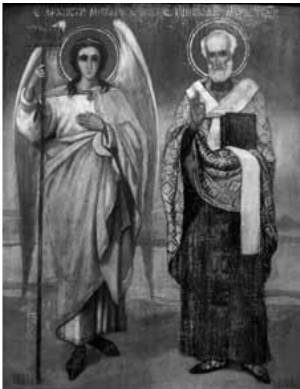
Икона «Архангел Михаил и Св. Николай».

Икона написана с учетом светских тенденций в изобразительном искусстве. Сразу же заговорили о предполагаемом авторстве этого произведения. Среди предполагаемых имен было упомянуто имя Виктора Васнецова! Действительно, икона напоминает его стиль и манеру знаменитых росписей для Владимирского собора в Киеве. Однако приходится говорить лишь о подражателе, воспринявшем его манеру. По всей видимости, это был молодой художник, прошедший обучение в академии художеств.