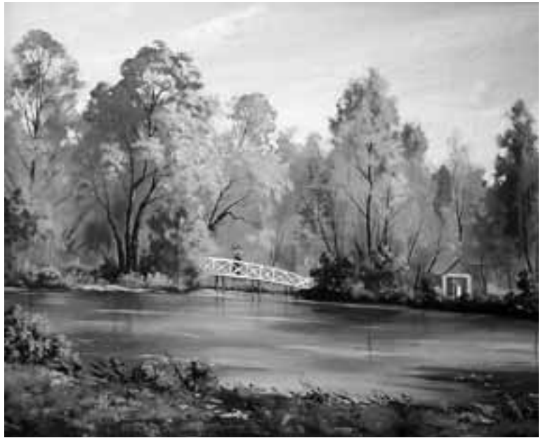
А.Н.Баргов. Болдинская осень 1999.

«Ах, мой милый! — пишет Пушкин П.А. Плетневу 9 сентября 1830 года. — Что за прелесть здешняя деревня! Вообрази: степь да степь; соседей ни души; ездить верхом сколько душе угодно; пиши дома сколько вздумается, никто не помешает». Однако судьба приготовила Пушкину «отвратительную насмешку» — так в письме к невесте он называет холеру, а «Нижегородская губерния — самый центр заразы». Отрезанный от близких холерными карантинами, размытыми осенней слякотью дорогами, близкий к отчаянью («Черт меня догадал бредить о счастье, как будто я для него создан», — из письма П.А. Плетневу от 31 августа 1830 года), Пушкин, как и в «михайловском заточении», преодолевает препятствия колоссальным выбросом творческой энергии. Его пребыванию в течение трех месяцев в осажденной холерой деревне суждено было стать знаменитой «Болдинской осенью»