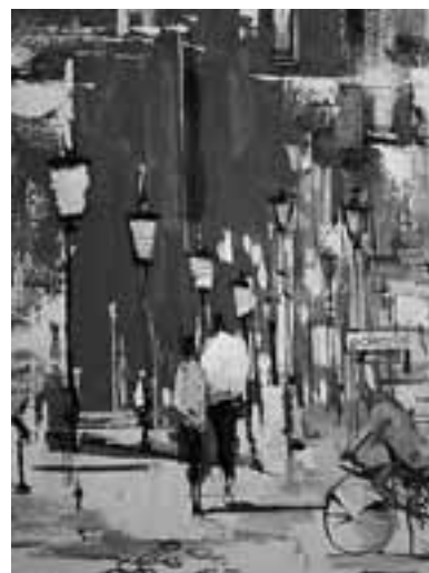
Евгения Октябрь. Солнечный день. 2010.

Выставку составили около 20 авторских произведений. Привычная для нее живописная техника раскрывает непривычные или нехарактерные образы, которые больше всего напоминают застывшие миражи. Пейзажи Берлина писались дома с помощью фотографий и личных впечатлений-импрессионарий. Представленные работы несут